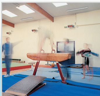
Salles de sport